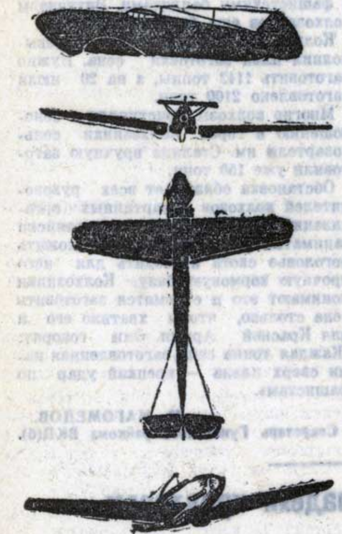
Мессершмитт ME — 109.

Товарищи, тщательно изучайте силуэты вражеских самолетов. Умейте по внешнему виду отличить фашистского стервятника от наших родных сталинских самолетов.