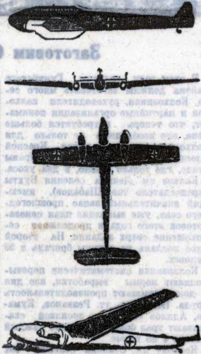
Мессершмитт ME — 110.

Снизу видны неширокие крылья. Винтомоторная группа выдается вперед. Края крыльев закругленные. Оттяжек к хвостовому оперению нет. Самое оперение имеет более острые края, чем у Мессершмитта — 109.